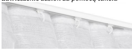
Zawieszenie zasłon za pomocą taśmy flex