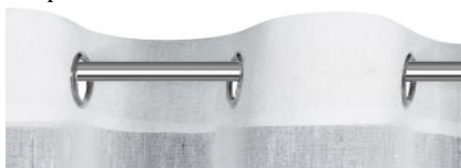
Zawieszenie zasłon za pomocą przelotek.