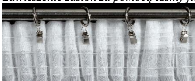
Zawieszenie zasłon za pomocą żabek